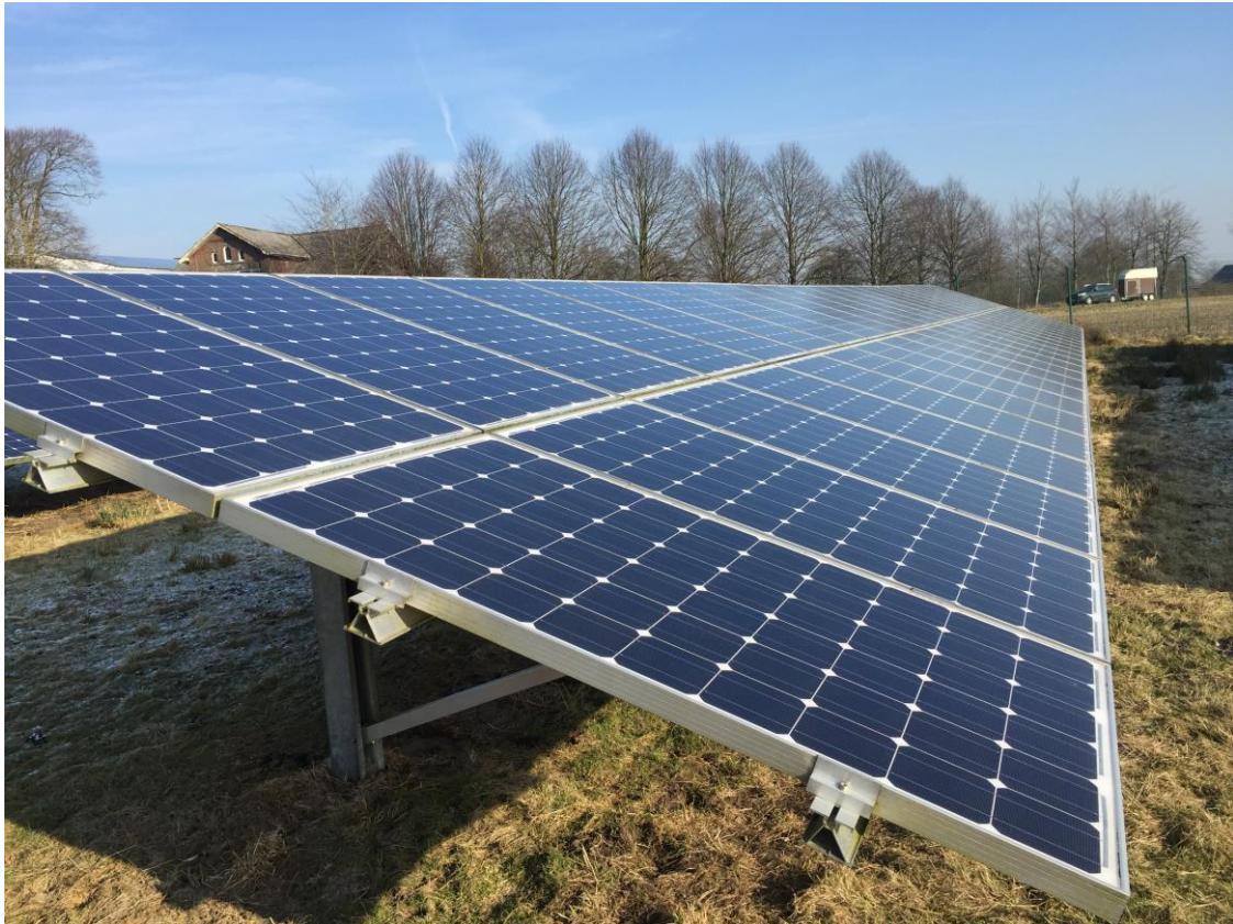
Bild 2: Beispiel einer PV-Freiflächenanlage mit 2 senkrechten Modulreihen

Mehrere Photovoltaikmodule werden auf einem Traggerüst montiert und bilden die sog. Modultische, welche reihenförmig neben- und hintereinander angeordnet werden. Die Modultische werden mit Hilfe von geramnten Pfosten aus verzinktem Stahl, ca. 1,00 m im Boden verankert.