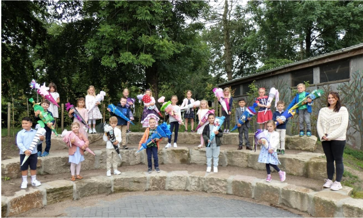
Stolz präsentieren die 21 eingeschulten Schülerinnen und Schüler ihre Schultüte

Die Namen der 21 neu eingeschulten Schülerinnen und Schüler: