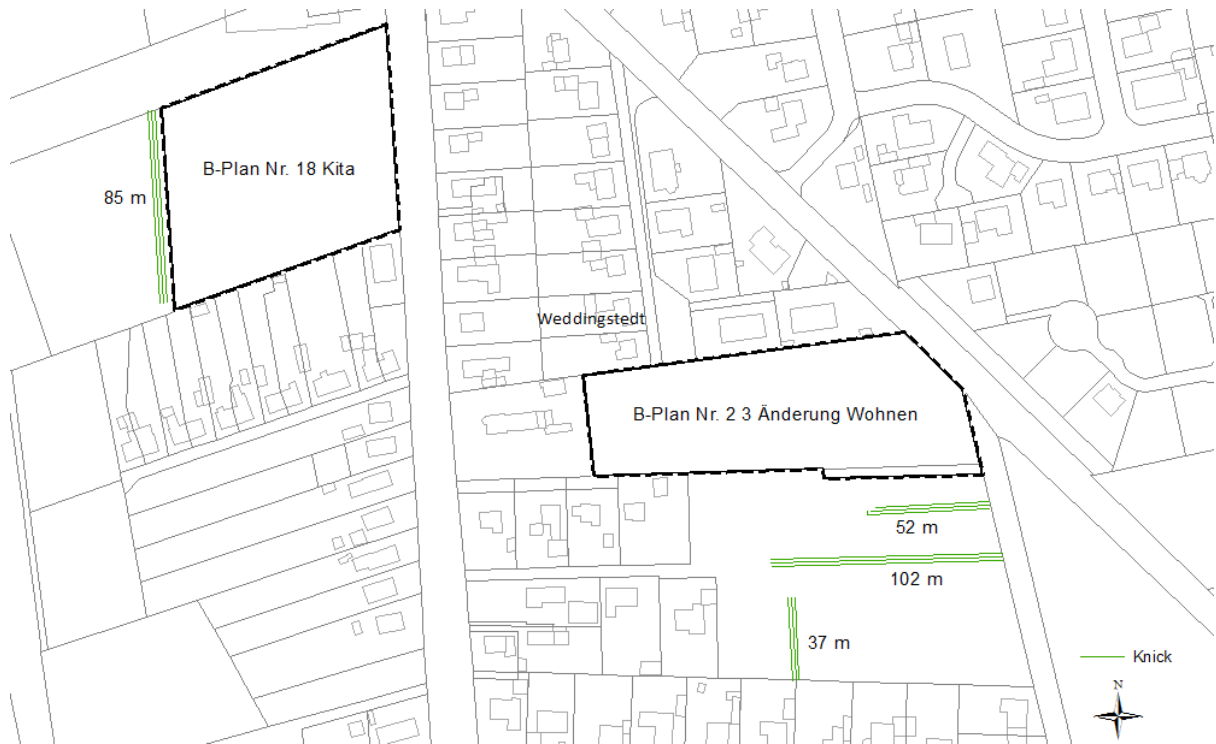
Abbildung 3: Neuanlage der Knickstrukturen

Unter Berücksichtigung der Verminderungs- und Schutzmaßnahmen sowie der externen Kompensationsmaßnahmen (vgl. Eingriffs-, Ausgleichsbilanzierung Tab. 3) ist der, durch die Aufstellung der 3. Änderung des Bebauungsplanes Nr. 2 vorbereitete Eingriff in das Landschaftsbild und den Naturhaushalt ausgeglichen bzw. es steht noch "Kompensationsguthaben" für weitere Eingriffe zur Verfügung.