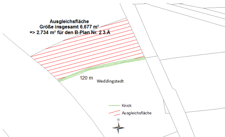
Abbildung 1: Lage der Ausgleichsfläche ("540/86")

Die Anlage des Knicks sollte nach der Abbildung 2 „Zielvorstellung idealer Knick“ erfolgen. Für die Bepflanzung des Knickwalls werden die Gehölzarten aus der „Liste typischer Gehölzarten Schleswig-Holsteinischer Knicks“) empfohlen, insbesondere die Gehölzarten der Schlehen-Hasel-Knicks: